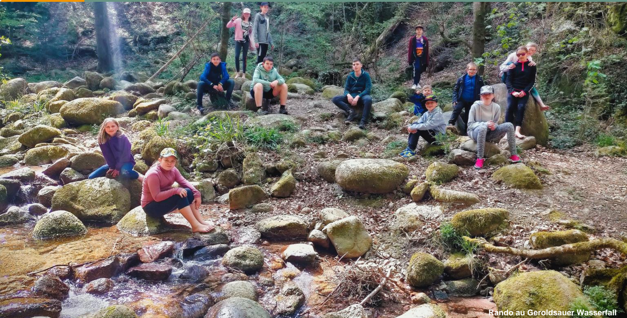
Rando au Geroldsauer Wasserfall

Animation Jeunesse FDMJC d'Alsace de la Communauté de Communes de la Plaine du Rhin