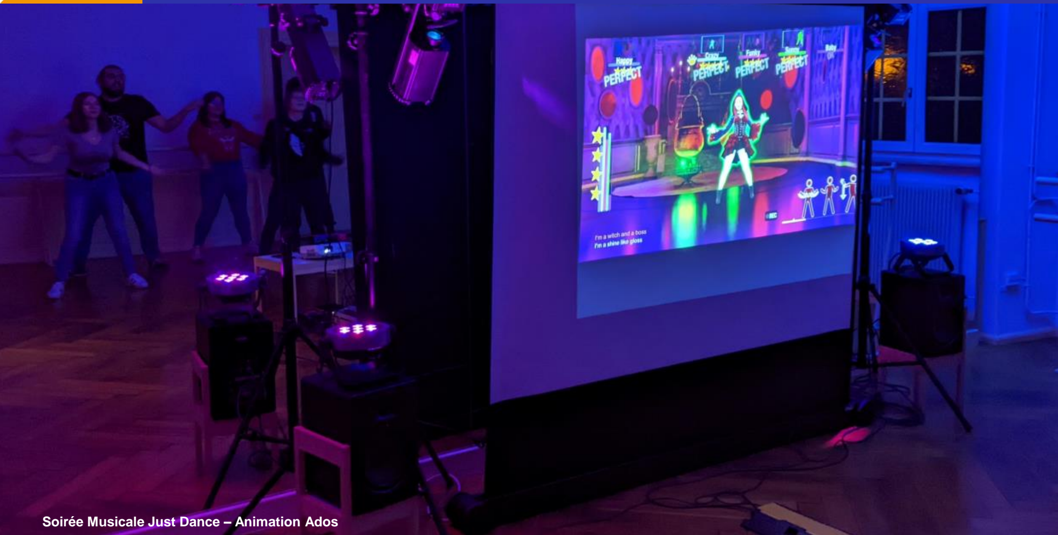
Soirée Musicale Just Dance – Animation Ados

Animation Jeunesse FDMJC d'Alsace de la Communauté de Communes de la Plaine du Rhin